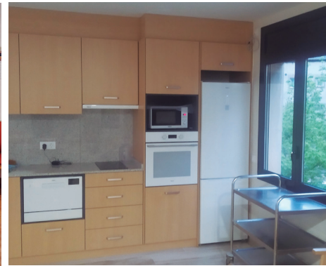
D'esquerra a dreta i de dalt a baix: planta 1 en obres (pavelló Mare de Déu del Claustre), espai on s'ha instal·lat la nova sala de calderes, habitació doble reformada, nova sala d'activitats de la planta 1 (pavelló Mare de Déu del Claustre) i nova cuina d'aquesta mateixa sala.